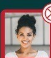
Paisagem ao fundo