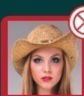
Uso de chapéus