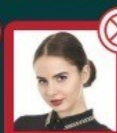
Olhando de lado